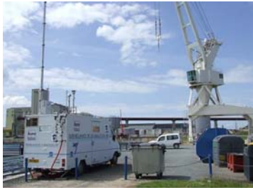
Site n°1 : sur le port de service, le camion laboratoire a mesuré poussières, oxydes d'azote, dioxyde de soufre et COV.