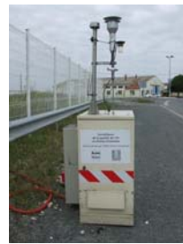
Le site n°3 a évalué l'impact de l'activité portuaire sur les particules fines vers les habitations à l'est du port.