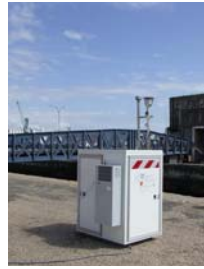
Site n° 2 : près de l'écluse, la surveillance des poussières et des oxydes d'azote a permis de localiser les sources d'émission.