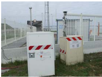
Site n°5 : à l'entrée du môle d'escale, deux armoires de mesure se sont complétées pour surveiller particules, oxydes d'azote et hydrocarbures.