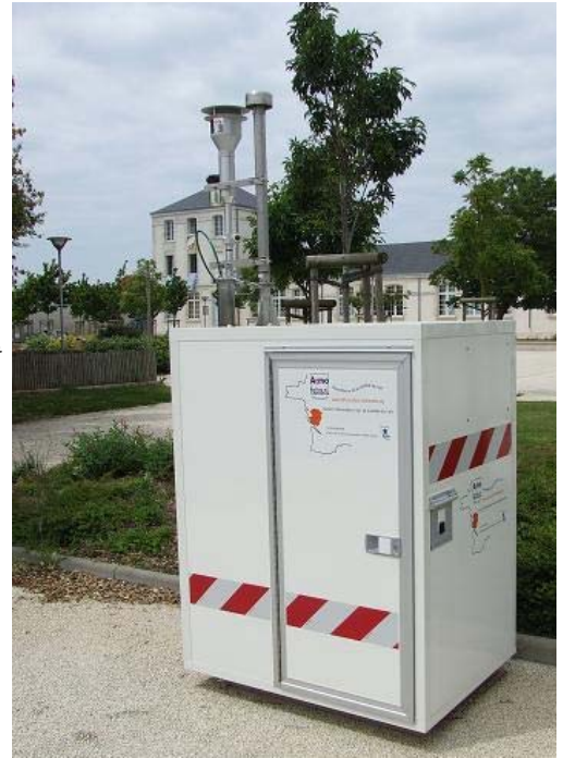
À La Pallice (site n°4), ATMO a quantifié l'influence du port, par comparaison des résultats de mesures lorsque le site était exposé au port et lorsqu'il ne l'était pas.