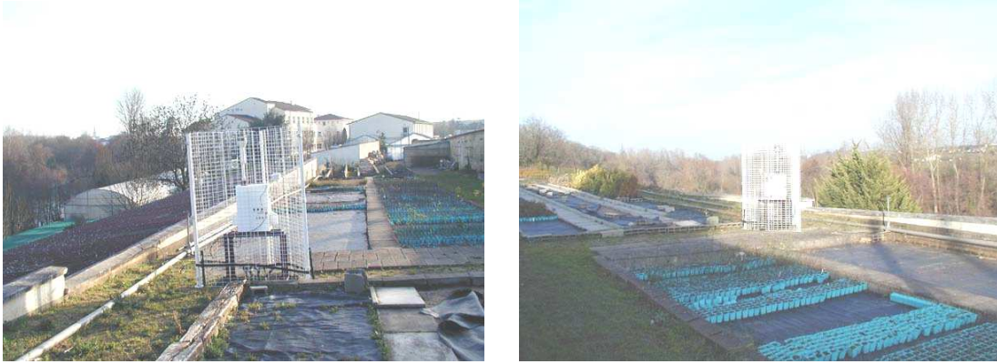
Figure 7 : Prélèvement à l'extérieur des serres

Un blanc terrain est réalisé dans la grande serre du 2/02 18h au 3/02 14h. La réalisation d'un blanc terrain consiste à faire suivre à un échantillon le même parcours qu'un échantillon habituel mais sans le soumettre à un prélèvement. Le blanc terrain reste posé dans le préleveur dans son emballage pendant la durée du prélèvement. L'objectif de ce blanc est de vérifier l'absence de contamination lors des différentes étapes du parcours de l'échantillon.