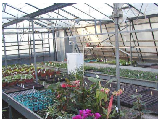
Figure 5 : Prélèvement dans la petite serre

Les prélèvements ont été réalisés du 2 au 11 février 2004. 3 préleveurs ont été utilisés pour effectuer ces prélèvements. Un DA80 a été placé dans chacune des deux serres. Ce type de préleveur permet de faire des mesures sur une durée comprise entre seize et vingt-quatre heures. Un Partisol 2000 a été utilisé pour les mesures en extérieur, il a permis de faire une mesure d'une semaine.