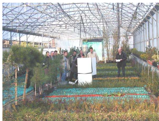
Figure 6 : Prélèvement dans la grande serre

Les pesticides sont piégés sur filtres et mousses afin de retenir à la fois la phase gazeuse et la phase particulaire. Ces supports de prélèvement ont ensuite été apportés au laboratoire Ianesco Chimie pour détermination des teneurs piégées. Les concentrations présentes dans l'air environnant sont ensuite déterminées en ramenant les quantités piégées au volume d'air prélevé.