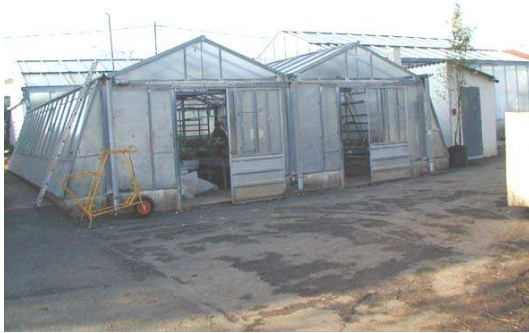
Figure 1 : Petite serre

Les mesures ont été réalisées dans deux serres différentes. La première représente un volume de 135 \text{ m}^3 pour une hauteur moyenne de 2,70 mètres. Les végétaux qui s'y trouvent sont placés sur des tablettes et sont à des stades de développement peu avancés. Le pulvérisateur utilisé dans cette serre pour le traitement à l'endosulfan est un pulvérisateur à jet projeté. Ce matériel, qui projette des gouttelettes d'un diamètre compris entre 300 et 400 micromètres, est particulièrement adapté pour le traitement de petites surfaces et le traitement de végétaux peu développés. Après étalonnage, il a été décidé d'utiliser 13 millilitres de produit pour traiter l'ensemble de la serre.