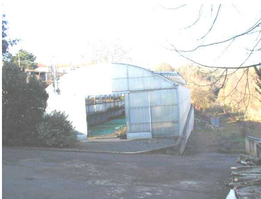
Figure 3 : Grande serre

La deuxième serre présente des dimensions nettement supérieures à la première, son volume est de 1500 \text{ m}^3 pour une hauteur moyenne de 4,10 mètres. Les végétaux présents dans cette serre ont atteint des stades de développement plus avancés que ceux de la première serre. Pour le traitement à l'endosulfan, un pulvérisateur pneumatique a été utilisé. Ce pulvérisateur utilise un flux d'air pour transporter le produit sur les végétaux sous forme de gouttelettes dont le diamètre va de 50 à 250 micromètres. Ce type de pulvérisation est plus adapté aux végétaux à grand développement et est plus pratique pour les grandes surfaces. Après étalonnage, la dose d'endosulfan nécessaire au traitement a été évaluée à 25,5 millilitres.