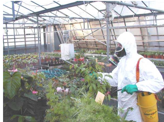
Figure 2 : Traitement dans la petite serre

La deuxième serre présente des dimensions nettement supérieures à la première, son volume est de 1500 \text{ m}^3 pour une hauteur moyenne de 4,10 mètres. Les végétaux présents dans cette serre ont atteint des stades de développement plus avancés que ceux de la première serre. Pour le traitement à l'endosulfan, un pulvérisateur pneumatique a été utilisé. Ce pulvérisateur utilise un flux d'air pour transporter le produit sur les végétaux sous forme de gouttelettes dont le diamètre va de 50 à 250 micromètres. Ce type de pulvérisation est plus adapté aux végétaux à grand développement et est plus pratique pour les grandes surfaces. Après étalonnage, la dose d'endosulfan nécessaire au traitement a été évaluée à 25,5 millilitres.