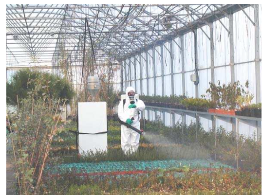
Figure 4 : Traitement dans la grande serre